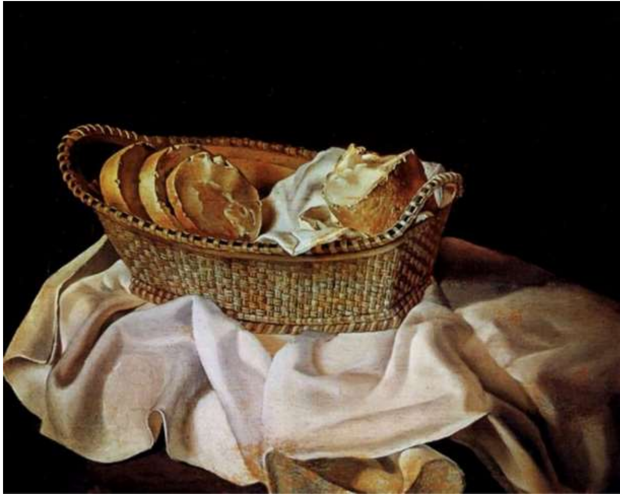
Σαλβαδόρ Νταλί «Καλάθι με ψωμί» 1926

Το «Καλάθι με ψωμί» είναι ένας πίνακας του Ισπανού σουρεαλιστή ζωγράφου Σαλβαδόρ Νταλί. Ο πίνακας απεικονίζει τέσσερα κομμάτια ψωμιού με βούτυρο μέσα σε ένα καλάθι. Το ένα χωρίζεται από τα άλλα και είναι μισοφαγωμένο. Το καλάθι βρίσκεται πάνω σε ένα λευκό πανί. Ο πίνακας βρίσκεται στο Μουσείο Σαλβαδόρ Νταλί, Αγία Πετρούπολη, Φλόριντα (ΗΠΑ). Είναι ένας από τους πρώτους από τους πολλούς πίνακες με ψωμί του Νταλί.