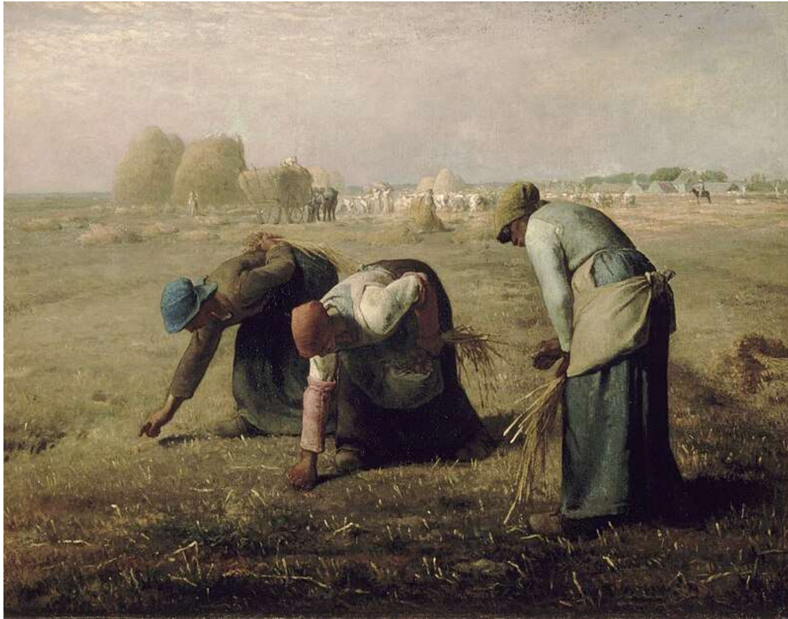
Ζαν-Φρανσουά Μιλέ «Οι σταχωμαζόχτρες» 1857

«Οι σταχωμαζόχτρες» είναι μία ελαιογραφία του Ζαν-Φρανσουά Μιλέ. Απεικονίζει τρεις αγρότισσες να σταχυολογούν ένα χωράφι με αδέσποτα κοτσάνια σίτου μετά τη συγκομιδή. Ο πίνακας είναι διάσημος γιατί ενώ απεικονίζει με συμπαθητικό τρόπο τις κατώτερες τάξεις της αγροτικής κοινωνίας, έτυχε κακής υποδοχής από τις Γαλλικές ανώτερες τάξεις. Ο πίνακας αυτός βρίσκεται στο Musée d'Orsay, Παρίσι.